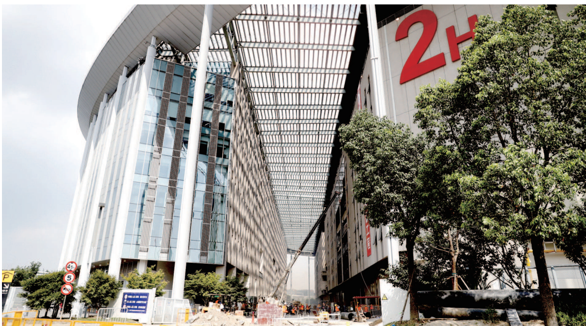
国家会展中心(上海)1号、2号馆“加层改扩建”正加紧推进,预计将新增6万平方米可展览面积。

配套设施也在有条不紊地推进之中。由申虹公司负责的国家会展中心(上海)地下人行通道东段、西