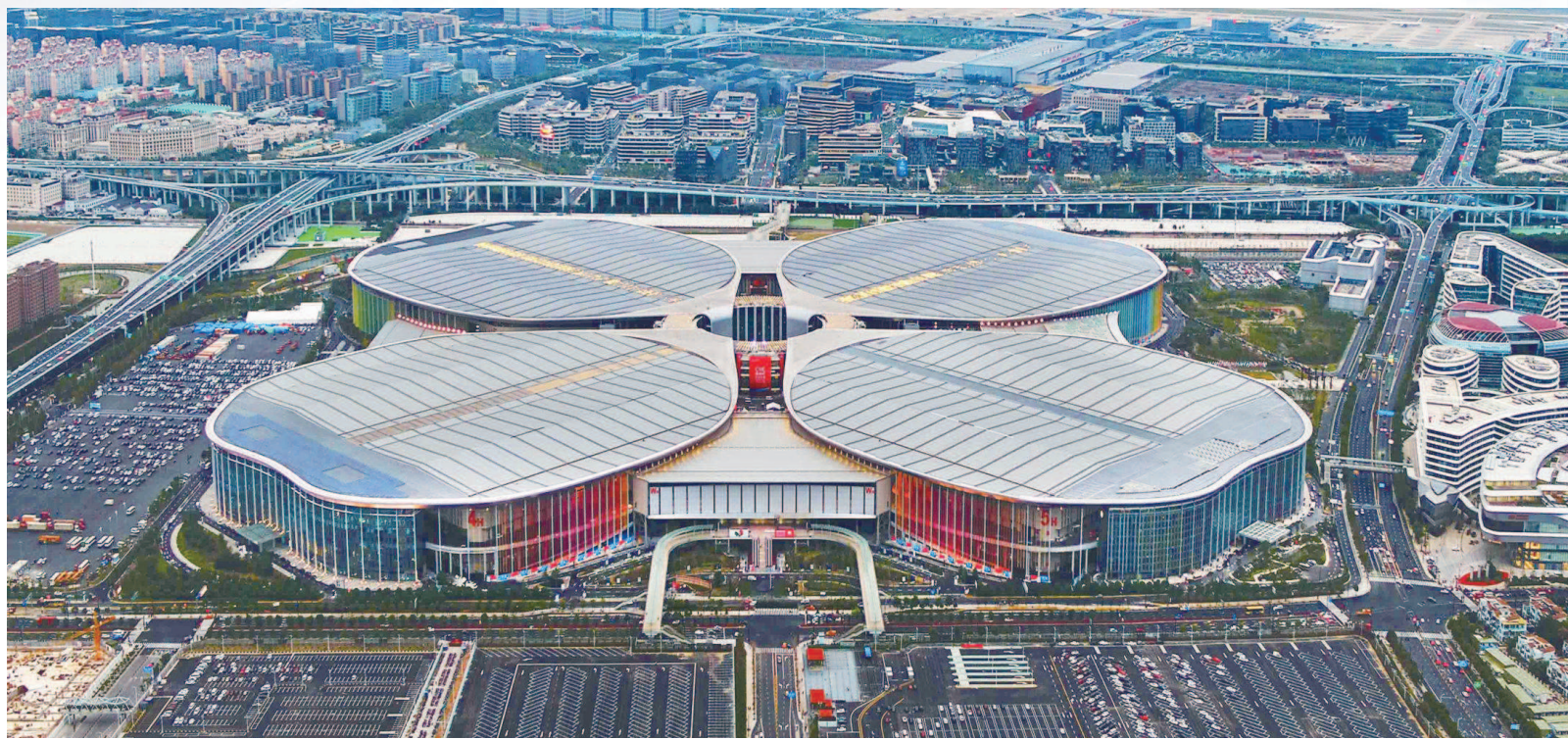
第二届中国国际进口博览会将于2019年11月5日至10日在国家会展中心(上海)举办。

第二届进博会将继续设立中国馆。今年,中国馆将聚焦新中国成立70周年主题,展示我国经济社会发展成就和新时代新机遇。据进博会城市服务保障领导小组办公室主任尚玉英透露,进博会国家展将组织10天延展,让更多市民充分感受我国改革开放巨大