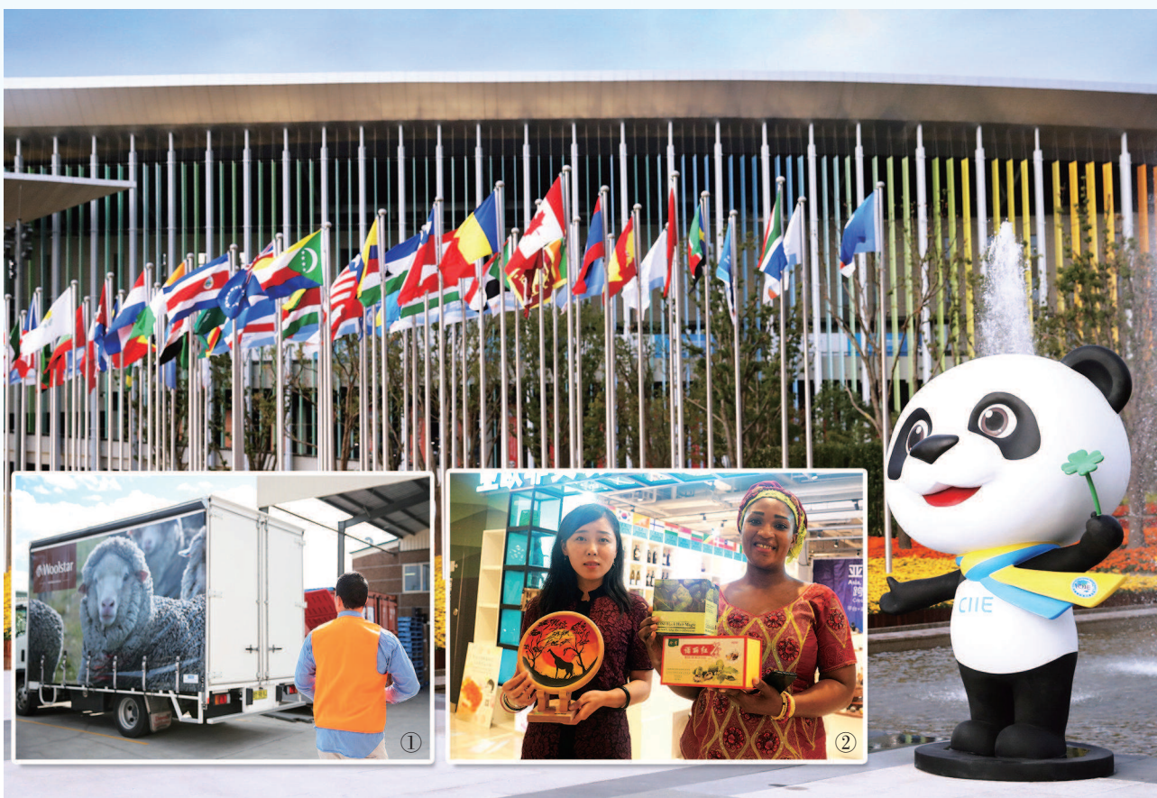
①作为首届进博会的参展企业,澳大利亚羊毛产品有限公司渴望再到中国去。今年,该公司将第二次参加进博会。图为8月22日,工作人员在悉尼的工厂中走进产品运输车。