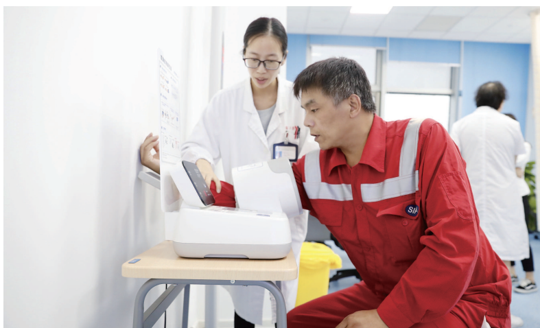
两个“小岛医疗点”有效解决了小洋山岛职工的就医难题。本报记者 袁婧摄

8月17日晚7时许,浦东新区医疗急救中心小洋山分站接到了投用后的第一个呼救电话,用时仅13分钟,急救人员就赶到患者身边,40分钟后将患者安全送达位于临港的市六医院东院,整个急救过程较以往缩短了一个多小时。