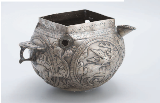
← 粟特银器之图鲁舍沃村银灯