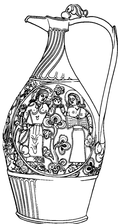
粟特银壶(线稿图),可以一窥壶上装饰反映的社会生活场景