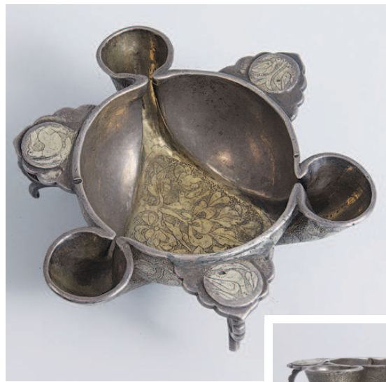
← ↓ 粟特银器之银灯 (俯视图与侧视图)