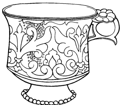
斯捷尔利塔马克银带把杯(线稿图)