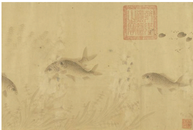
《群鱼戏荇图卷》(局部) ↓

尾鲮鱼在嬉水之状，时而密集，时而疏散，有昂仰，有俯首，有侧身，姿态各异，反应至敏，游速至捷，水草萍藻随着鲮鱼的游踪之势而缓缓浮动，画面非常静谧。鲮鱼的头至背尾都用深墨作晕染，腹部留白，而鱼鳍以稍淡的墨染就，凸出圆润光滑之感。水草用墨青细笔轻勾，轻舞于鲮鱼之间。画上无款印，是否为赵克复亲笔，尚有争议，笔者发现他所经营的位置都集中在右下方一角，类似马远山水的一角法，疑为南宋人所作。此幅曾在2016年5月7日至10月11日举办的“大都会馆藏中国书画精品特展”上展出。