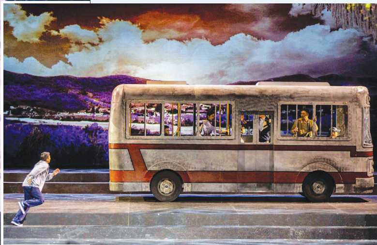
▲音乐剧《繁花尽落的青春》日前赴韩国参加第13届大邱国际音乐节展演,并获得“最佳国际音乐剧”奖。