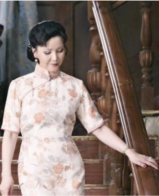
《雷雨》几乎伴随了茅善玉的沪剧生涯，少女时代饰演四凤，如今成为中流砥柱的她，凭借繁漪一角拿下“二度梅”。她甘愿甘为人梯，为未来一代配戏饰演鲁妈。