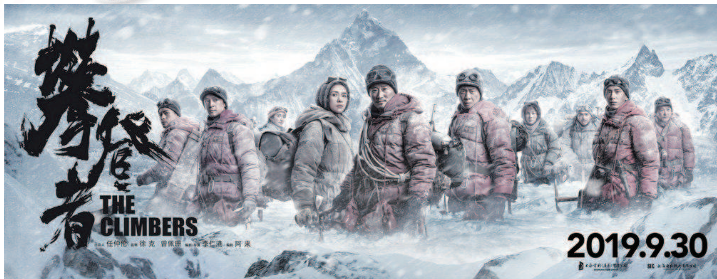
导演:李仁杰 编剧:阿来 监制:徐克 主演:吴京、章子怡、张译、井柏然、胡歌等 聚焦中国第一代珠峰攀登者,讲述他们在1960年、1975年两次登顶世界之巅的卓绝奋斗。