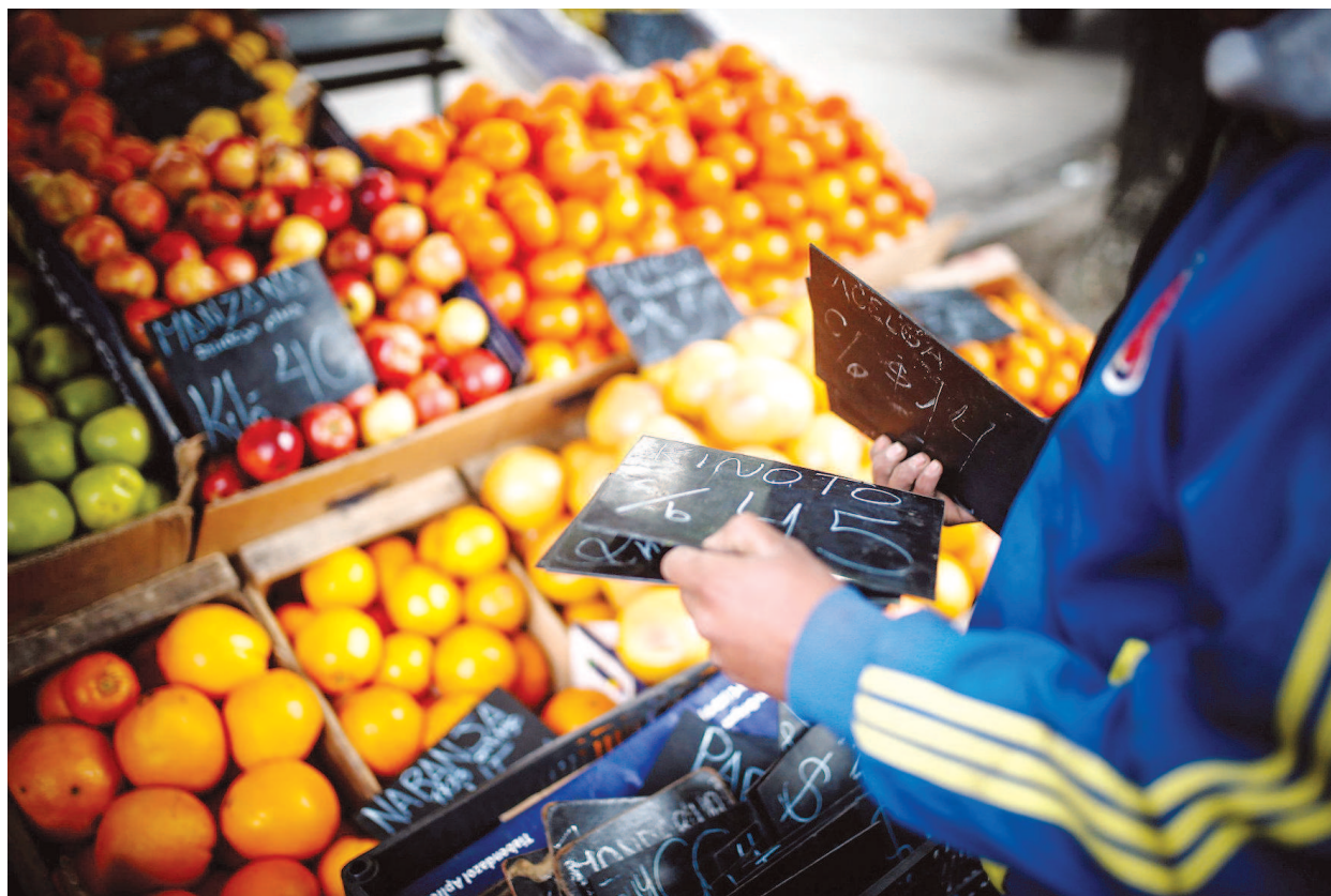
14日，在布宜诺斯艾利斯，因通货膨胀，一名员工在街头市场改变产品的价格标签。

美国智库大西洋理事会阿根廷问题专家葆拉·加西亚·塔夫罗说，马克里政府的最新举措针对那些“受经济危机影响最严重、在这次初选中不再支持马克里的人”。