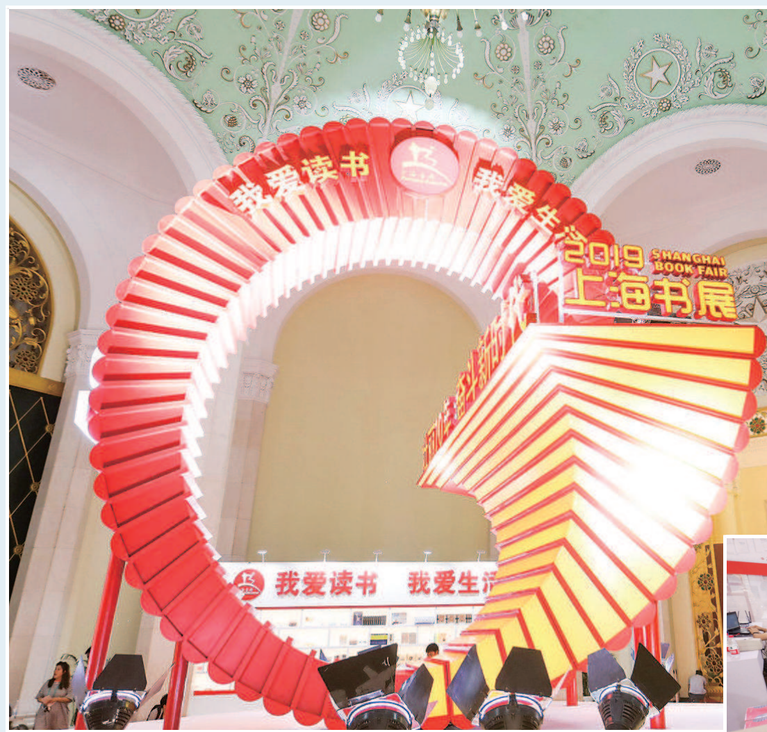
书展会场布展工作已就绪，静候广大读者光临。

作为上海书展主题活动之一，昨天举办的“不忘初心 奋力前行——用文明的力量为新时代明德”主题出版论坛上，党史专家刘统分享了