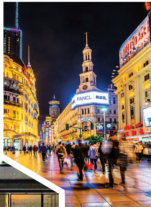
▲南京路购物步行街 ▲大学路的“深夜书店”