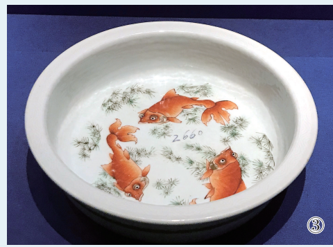
①在故宫延禧宫拍摄的金鱼。新华社记者 金良快摄 ②釉里红四鱼纹水丞(清康熙)。 ③粉彩金鱼水藻图洗(清雍正)。(均资料照片)