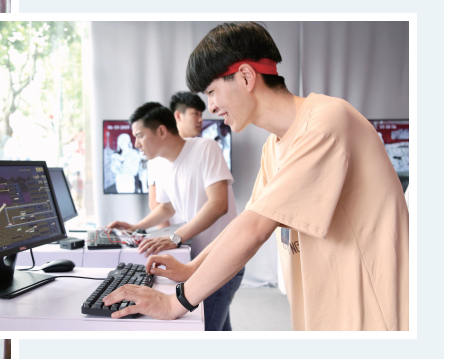
观众现场体验《AI争霸》游戏。

展览也将融入多项AI前沿技术:艺术家张赢的《练习课》将印象派大师梵高和新表现主义大师蒙克的3D人脸重塑置于展厅内;艺术家刘佳玉的《上海天空的艺术表达》则运用AI遥感技术,观众可实时看到地球另一端天空的云彩变化;艺术家周福海的《与雕塑的互动》则运用了实时深度估计和三维重建技术。商汤科技遥感事业部总经理张琳认为,艺术与科技是两个高冷的领域,它们的深度融合,能够为普通人的生活构建起一条全新通道,为艺术产业的未来带去更多想象空间。