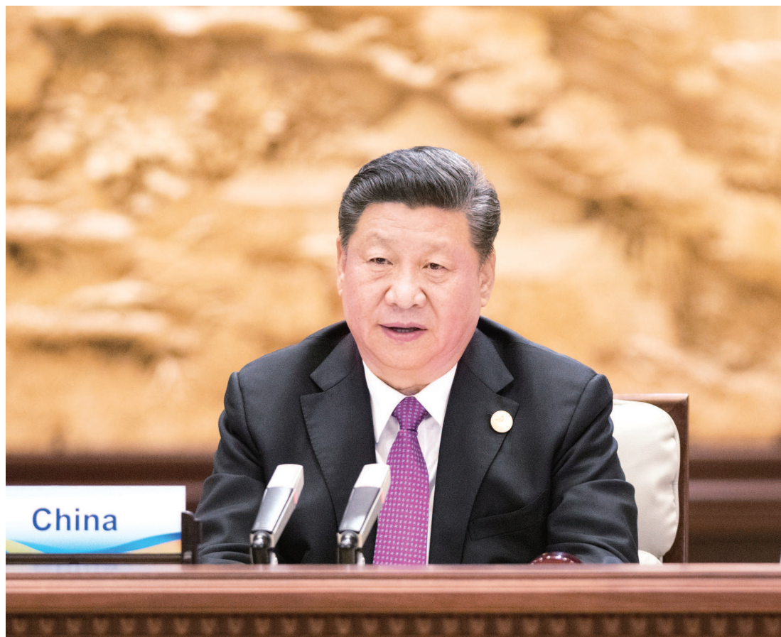
国家主席习近平主持会议并致开幕辞。