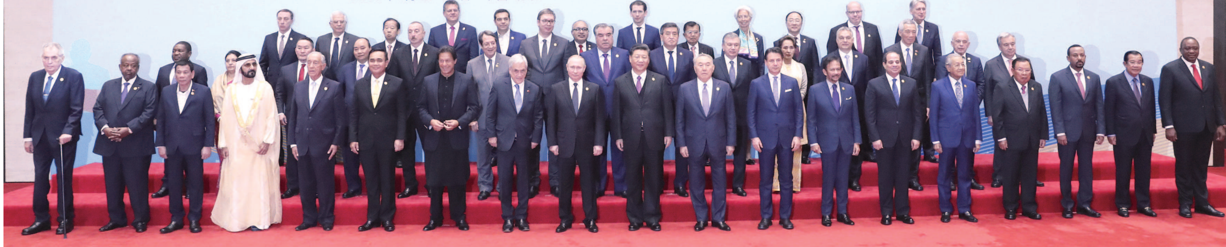
第二届“一带一路”国际合作高峰论坛在北京雁栖湖国际会议中心举行圆桌峰会，国家主席习近平主持会议并致开幕辞。当天中午，习近平同与会领导人和国际组织负责人集体合影。