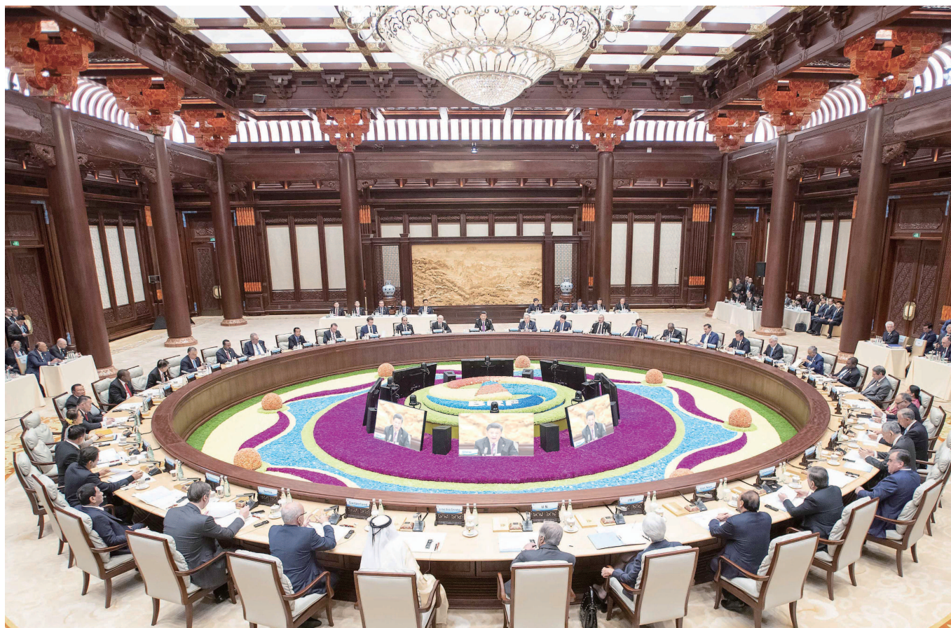
第二届“一带一路”国际合作高峰论坛在北京雁栖湖国际会议中心举行圆桌峰会。