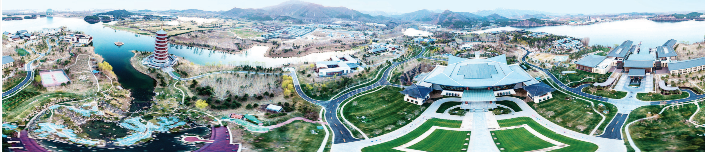
无人机拍摄的北京雁栖湖(拼接照片,4月1日报)。

习近平昨同智利总统举行会谈，还分晤莫桑比克总统、阿塞拜疆总统、埃塞俄比亚总理、缅甸国务资政、国际货币基金组织总裁、日本首相特使