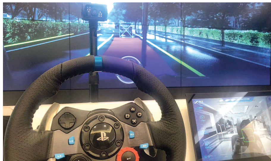
在商汤科技展厅里,人们可以体验自动驾驶。