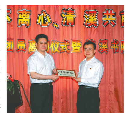
今日“高桥中学”新貌④