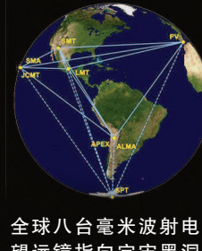
全球八台毫米波射电望远镜指向宇宙黑洞