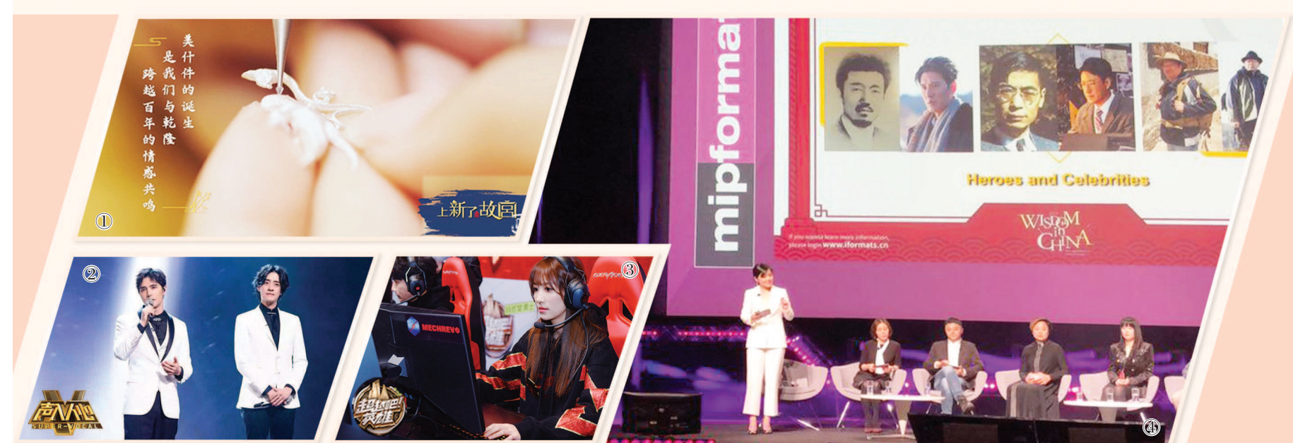
第二届“中国节目模式新机遇”由国家广播电视总局指导。连续两年,这项推介会都是中国原创节目模式集体向世界亮相的重要活动。活动旨在打造中外沟通平台,铺设中国节目模式“走出去”的海外通路。图①②③分别为《上新了·故宫》《声入人心》《超越吧英雄》剧照,图④为《闪亮的名声》在推介会现场。(“iFORMATS 中国节目模式库”供图 制图:李洁)