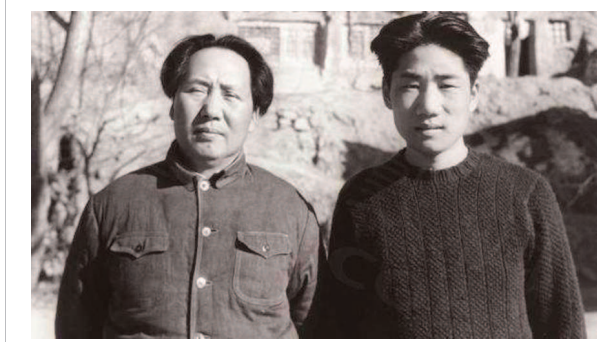
毛泽东与毛岸英(右)

审讯后，他在作战室先整理了审讯的笔录，又按彭总的指示，写一个通报，把莱尔斯提供的情况通报全军。这时杨凤安走进来，问：“毛秘书，通报起草得怎么样了？”毛岸英打了一个哈欠，说：