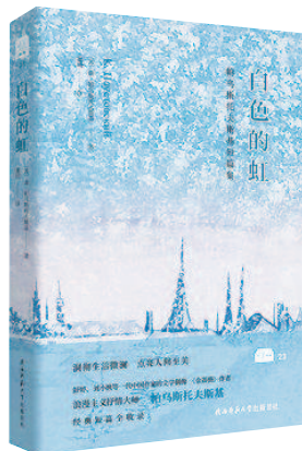
《白色的虹： 帕乌斯托夫斯基短篇小说集》 [苏]康·帕乌斯托夫斯基著 董晓译 陕西师范大学出版社出版

用绘画作比，帕乌斯托夫斯基是印象派，注重光线和色彩编织的气氛。曾以为这样的作家不大讲究人物性格的刻画，只注重人物的气质，就像印象派画家看重色彩甚于素描一样。他的人物，的确都具有浪漫的气质，与文字所洋溢的诗意相和谐。一般来说，这样的小说容易写得浮光掠影，千篇一律，可是像《制帆行家》《碎糖块》这两篇，却写出了异乎寻常的深