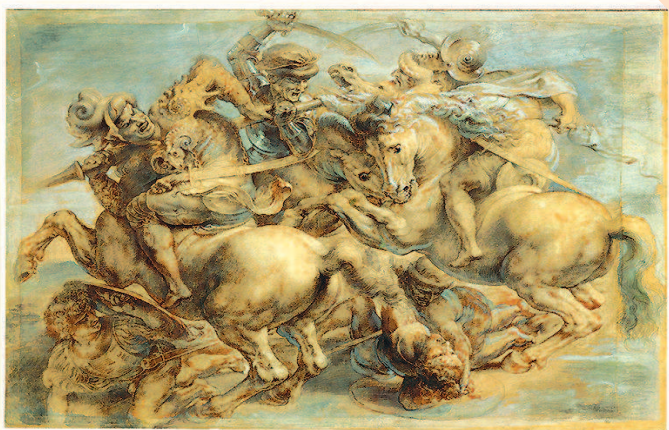
失而复得的艺术品：《安吉里之战》

并非所有失落的艺术品都彻底失落，因为失落的艺术品，甚至那些被认为是已经毁灭的艺术品，有时会重新浮现。