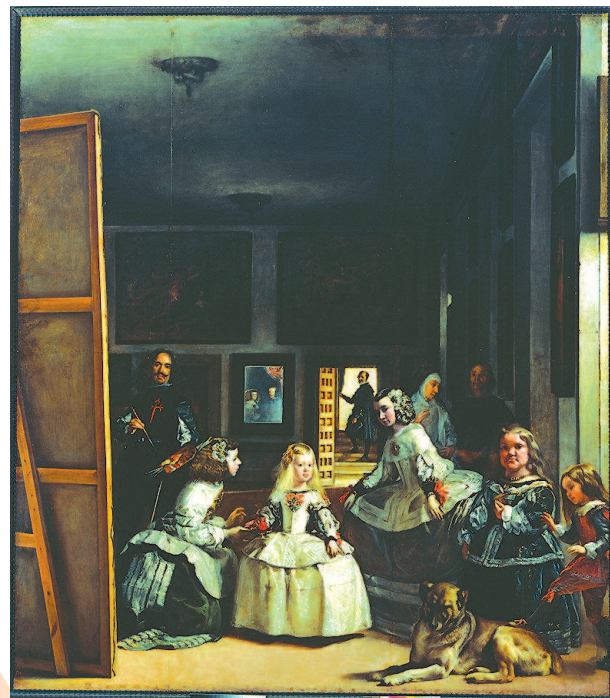
差点被大火吞没的名画：《宫娥图》

惯常的艺术史只是把大家耳熟能详的艺术品作出严肃认真的罗列，《失落的艺术》却是一部另类艺术艺术史，把大量失落的艺术及其背后的故事，如数家珍般讲给读者听。这些失落的艺术不局限于绘画、建筑、书籍、影像、雕塑、器物，还包括失落的城市、失落的遗物等。这是一部寻找被毁、失窃、遭到破坏的艺术品的艺术史，将成为主流艺术史之外不可或缺的艺术指南。