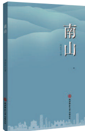
《南山》 高亚平著 陕西师范大学出版总社 (2019年1月版)

画手法。在勾画人物时，他采取淡笔勾画的手法，不画全身，也不工笔描摹，只是简单几笔就将人物勾勒出来了。《南山》的语言散发着浓郁的乡土气息，陕西方言得心应手的运用，自然也得益于作者深厚的生活积累，然而，我们又不觉得这些方言土语，这大概与平日里高亚平阅读甚丰，厚积薄发有关系，故此，从泥土中竟然生出典雅的气质来。