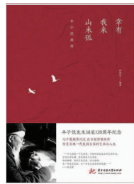
《幸有我 我来山未孤——丰子恺画传》 钟桂松编著 华中科技大学出版社 (2019年1月版)

在李叔同的牵线下，丰子恺也有幸与儒学大师马一浮结缘。丰子恺曾一度沉浸于丧母之痛难以自拔，看世间万事都觉无常，然而马一浮点醒他“无常就是常”，才让他恍然大悟，走出泥潭。而丰子恺与夏丏尊的缘主要体现在作文风格上。在浙一师范上学时，丰子恺于绘画方面受到李先生的指引，习作方面则受惠于夏先生的教诲。“不准讲空话，要老实写”的训导直到多年后依然时常在丰子恺耳畔回响，他笔下淡而有