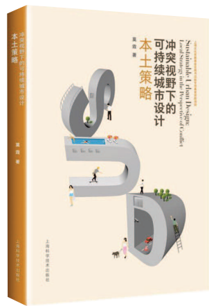
《冲突视野下的可持续城市设计：本土策略》 莫霞著 上海科学技术出版社出版

书中提到的这些冲突，正是转型期中国本土城市空间的可持续发展所主要面临的，也是当前中国特定发展阶段和环境正在发生、发展的。对于这些冲突领域的考察，具有地域性、阶段性、代表性；有关上海实践案例的探讨，对其他城市也很有裨益。正是基于这种“冲突”视野的建构和对于城市发展问题的不断反思，为我们搭建了一个更高视野、更深内在的平台。全书从理论解析到实践探索，从扎根现实