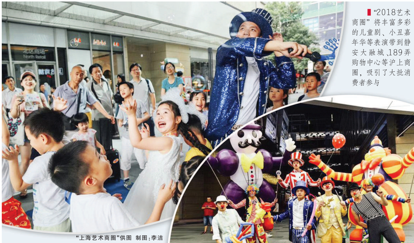
制图:李洁

“上海艺术商圈”于2017年首次推出。当年，160台节目、536场活动吸引了近25