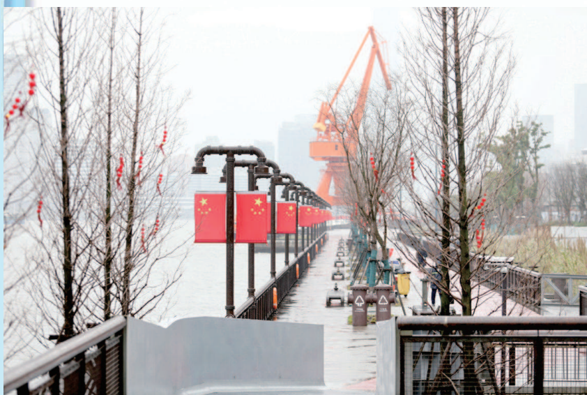
▲杨浦滨江绿道旁的公共空间保留了沿江企业的工业元素, 展现出独特魅力。

细心的市民会发现, 身边的林带里、河道边、绿地中, 出现了越来越多印着“上海绿道”字样的道路。最新数据显示, “上海绿道”已累计建成671公里。根据“十三五”规划, 到2020年, 上海将建成1000公里绿道, 为市民提供更多绿色休闲空间, 大幅提升城市生态环境品质。