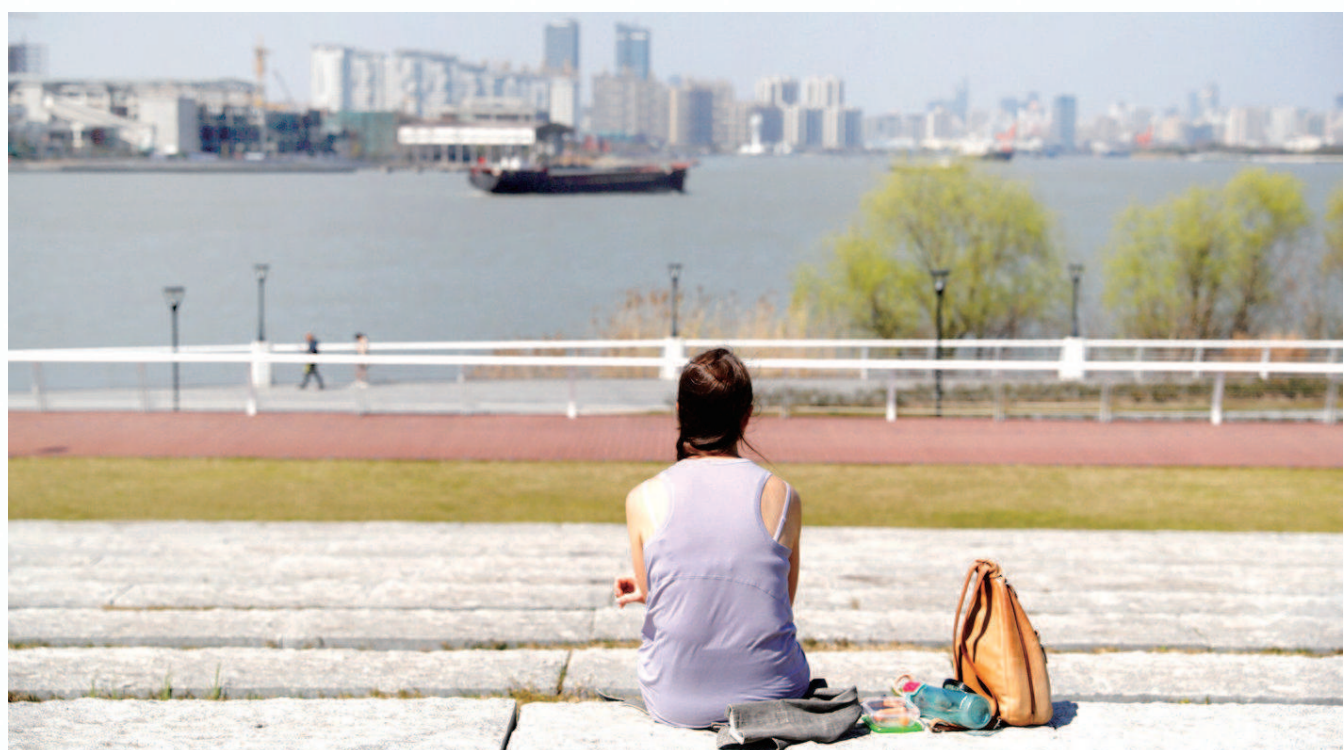
▲前滩公园内的绿道边顺势铺设了草坪阶梯, 游人可安静地坐上半天, 看黄浦江上船来船往, 放松心情。