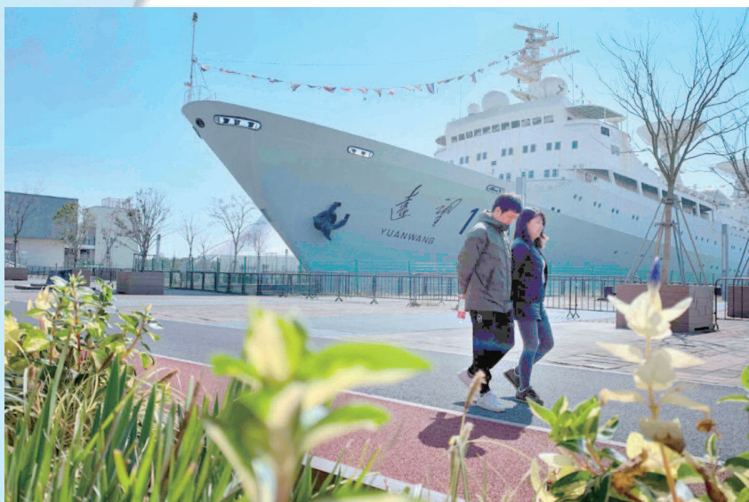
▲上海世博会浦西展区的绿道旁, 静静停靠着已经退役的我国第一代综合性航天远洋测量船“远望1号”, 成为特别的景观。