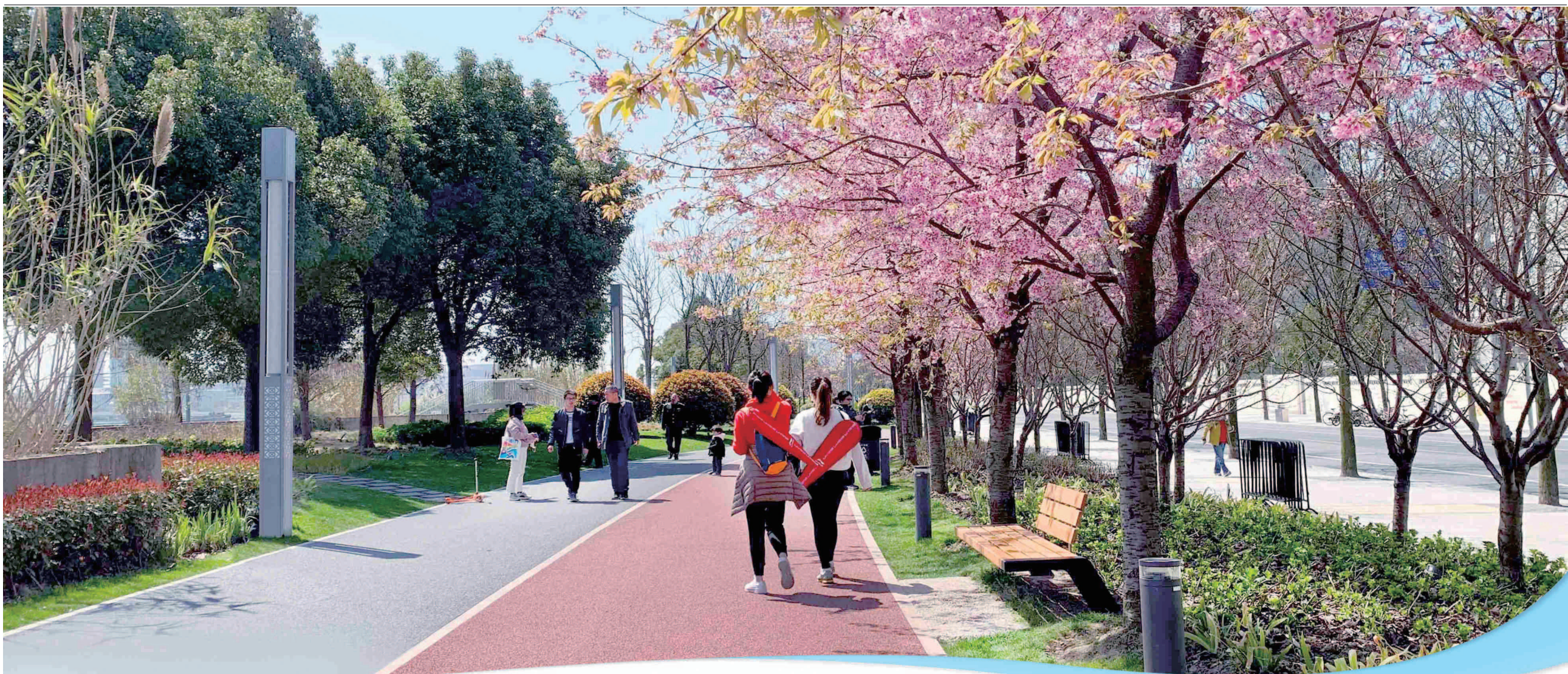
▲靠近南浦大桥的黄浦滨江绿道上种植了一排樱花树, 盛花时节引得市民游客纷至沓来。