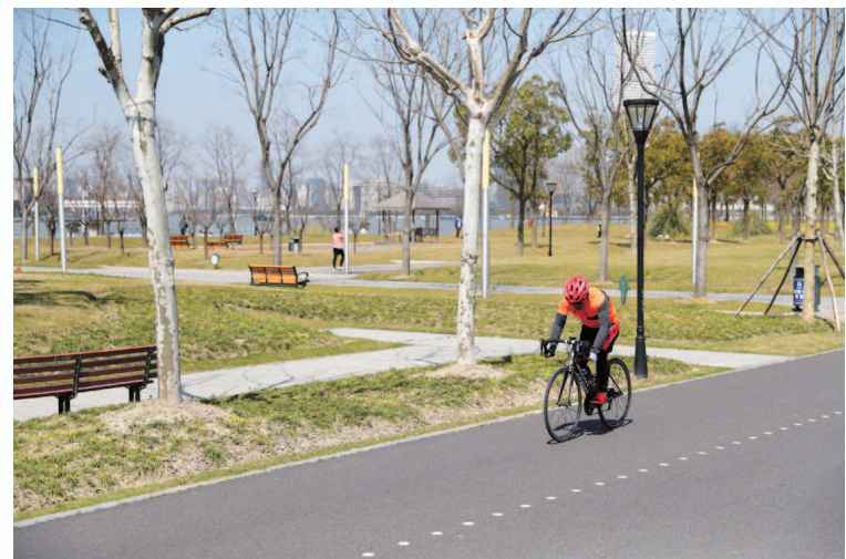
▲一些绿地、公园内的绿道还有宽敞平整的骑行道, 供骑行爱好者畅享速度激情。