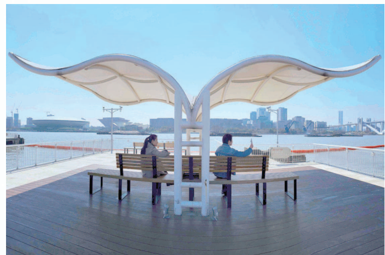
▲绿道边每隔一段距离都会有遮阳棚和座椅, 走累了, 可以停下歇脚。