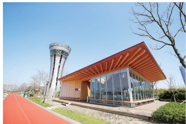
▲黄浦滨江东岸在跑步道和骑行道之间特别设立了望江驿, 游人在里面休憩、赏景。

未来, 申城绿道还将围绕“绿化、彩化、珍贵化、效益化”目标, 在建设中提高彩化比例, 丰富植物配置层次, 实现绿道景观的季相变化, 更加凸显不同绿道的个性和特色。