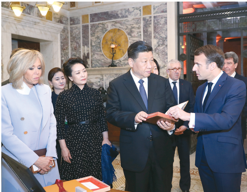
习近平在巴黎爱丽舍宫同法国总统马克龙会谈。