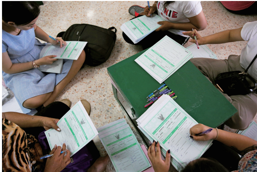
23日,泰国曼谷,泰国将于24日举行大选,选举官员进行准备工作。

24日,久违5年、推迟数次的泰国大选终于正式投票了!吸引了全球聚光灯,大家不仅关注结果如何,更关心泰国是否会再度动乱。 是哪几方在角逐执政权呢?泰国政坛主要分为支持王室-军方的一派(总理巴育等领导的党派和人士)和反对派(前总理他信和前总理英拉一派)。此次大选,前者使尽浑身解数想保住执政权,后者则想方设法铆足了劲把前者“拉下马”,欲取而代之。 目前支持王室和军方的政党主要有提名现任军政府总理巴育为总理候选人的民力党等;他信派的政党有为泰党、泰护国党等。这两派政党势不两立。此外,还有一些等待大选结束后待价而沽、立场不太明确的“中间势力”,如泰国存在时间最长(70多年)的老牌政党民主党,以及刚刚成立的新未来党等。