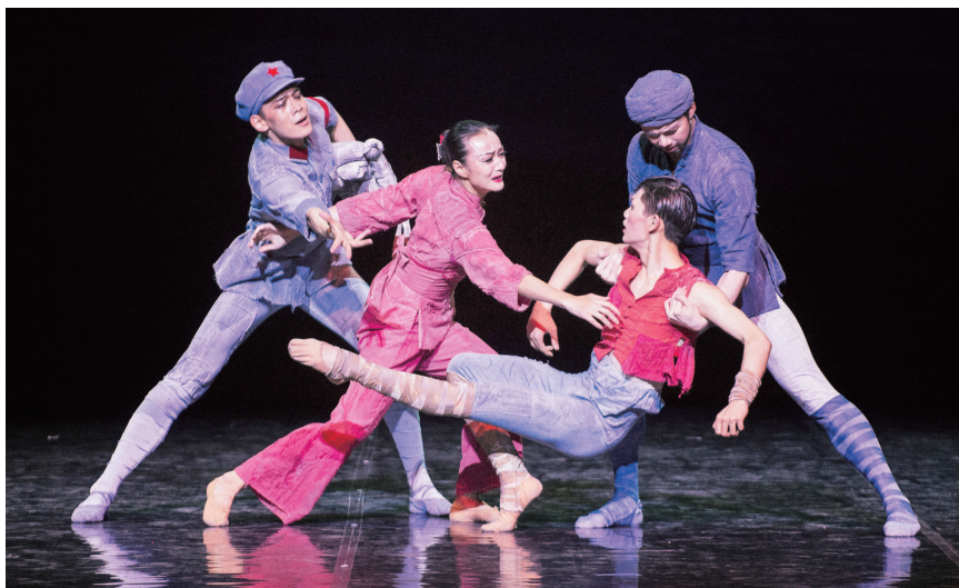
《闪闪的红星》印证着上芭致力于探索中国芭蕾舞创作的初心, 也担负着当下艺术工作者对弘扬红色文化、革命情怀的重任。

作为《闪闪的红星》故事的发源地, 在江西这片红色土地上, 每一处旧址, 每一片草木, 每一幅山水都诉说着“苏区精神”不朽的真谛。2018年《闪闪的红星》创排期间, 剧组演职人员就曾在江西革命老区采风, 寻觅着“潘冬子”的银幕光影为艺术创作汲取养分。此次, 趁着演出前的装台间隙, 上芭演职人员近百人前往南昌八一起义纪念馆, 重温苏区精神。