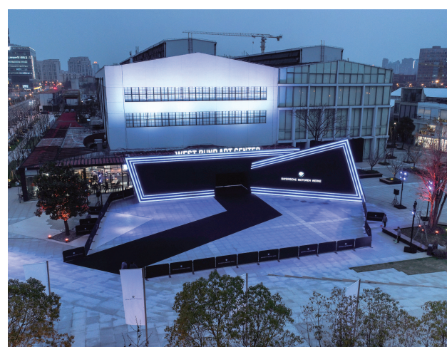
西岸文化艺术季将刷新和丰富区域多元化的生活体验。

20个文化艺术场馆举办近40场文化活动, 昨天揭幕的文化艺术季将持续至6月30日