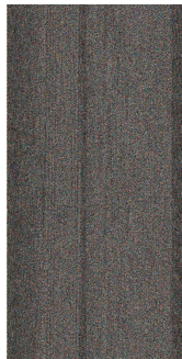
展览现场。