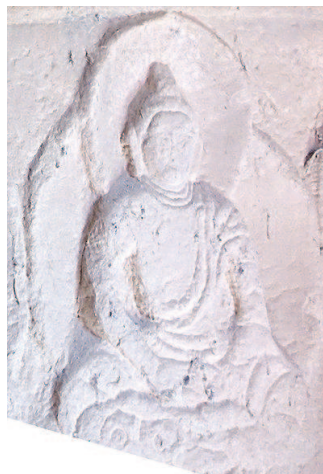
图十:杂木寺的思维手势坐佛像