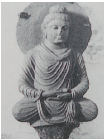
图十一:犍陀罗贵霜大月氏人坐佛像