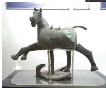
图十三:武威汉文化博物馆展出的有飞鸟座的陶马,现场照片

(即:同侧前后腿同时迈右或同时迈左),武威铜奔马就是走这样的对侧步,研究马步法的专家认为,大宛马便是走对侧步的高手。专家还说,武威岔口的驿马、青海湖的浩门马,多数走对侧步,现在离武威很近的山丹养马场的良马,也有很多走对侧步。武威铜奔马正是这种大宛马,而传来佛教的贵霜人就是在大宛的大月支人。这时的贵霜人接受了罗马帝国的骑兵作战的绘画艺术,把走对侧步的铜战马做成实战的形象,也是顺理成章的事。本文上面的插图中,战马的形象灵活多样,步态多样,对武威铜奔马会有重要的影响。武威铜奔马的步法,是适合骑兵作战的步法,可以随时应变,骑士的动作也各不相同,显示他们操控战马的动作也不一样。