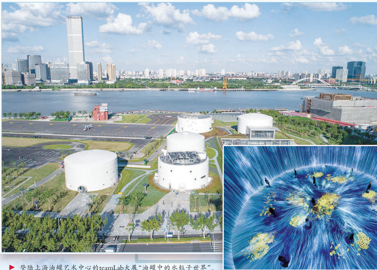
上海油罐艺术中心。