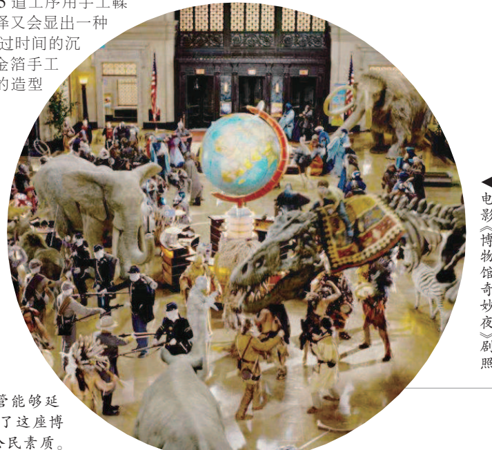
▲电影《博物馆奇妙夜》剧照

无疑,对于博物馆来说,用常态化的方式来维系夜场,或创造更多的夜间专场,面临巨大的考验,需要更大的经济投入。然而一旦这个问题解决好了,公众可能会更多地走进博物馆,反过来促进博物馆各方面的专业能力的提高,特别是博物馆休闲功能的开发。当然,晚间开放也会带来博物馆管理中另外一些方面的问题。比如,博物馆夜间开放不只是简单的时间延长,还需要量身打造服务环境和专门内容,也需要优质