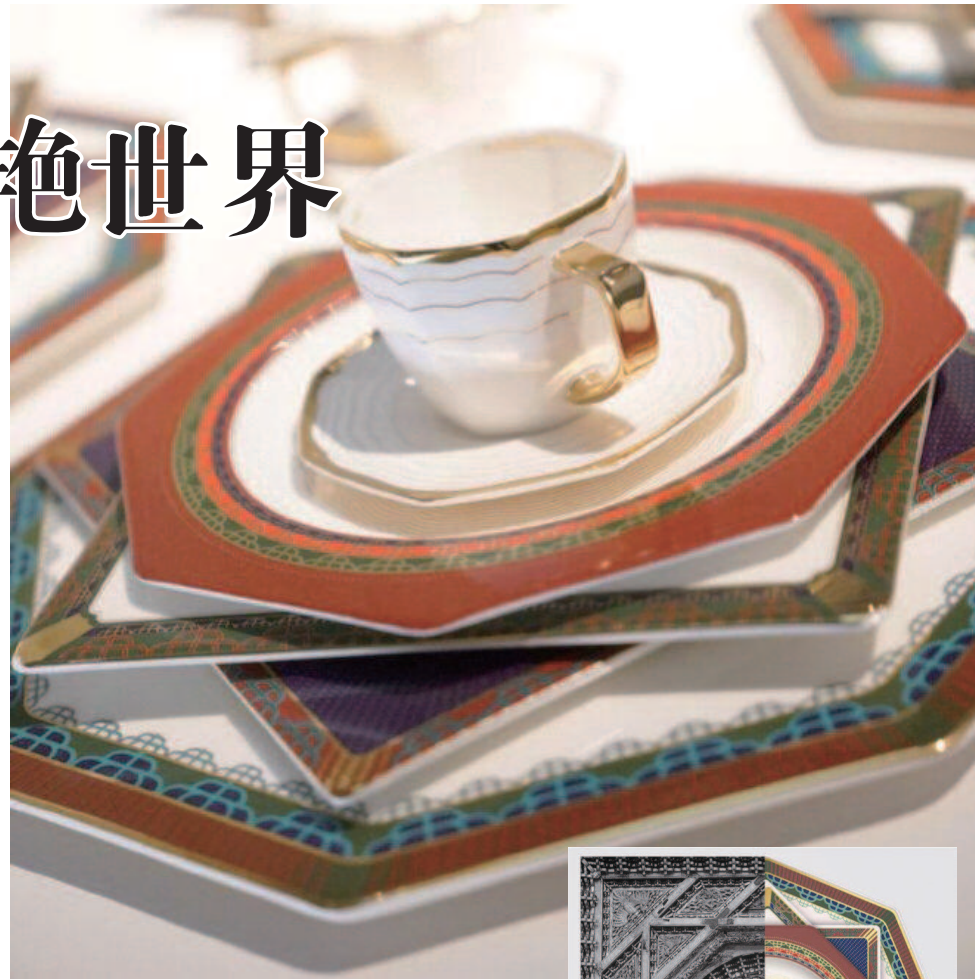
▲►设计师马聪以藻井为创意来源的《朝锦》系列作品惊艳2018米兰设计周 ▲参加第82届意大利佛罗伦萨国际手工艺博览会的《陌上·春》黎族织锦创意手包系列 (本版图片均为资料图片)