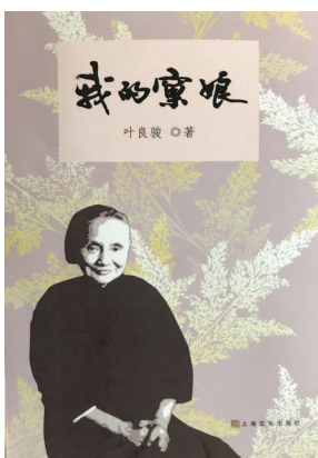
《我的窠娘》 叶良骏著 上海文化出版社出版

窠娘是一个善良的人,她的善良体现在她对叶良骏这个家庭的关爱上。她把全部的精力投入其中,想尽一切办法让全家过得更舒适、更体面一些。叶良骏的父亲在特殊的年代被贬大西北,母亲要挣钱养家,是窠娘全身心地照料着叶良骏和弟妹六人,让他们能在风雨飘摇的日子里感受到家的温暖。在那动乱的年代,叶良骏的妈妈无论怎么努力,挣来的工资也很难维持一家人的生活,窠娘毫不犹豫地