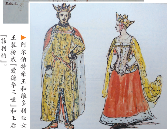
阿尔伯特亲王和维多利亚女王装扮成“爱德华三世”和王后“菲利普”。