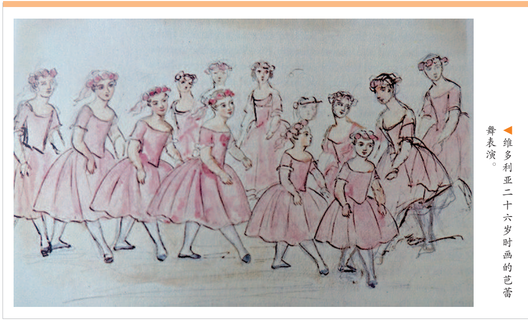
维多利亚二十六岁时画的芭蕾舞表演。

介绍,维多利亚在她八岁时迎来了人生中的第一节绘画课,她的绘画老师是英国大名鼎鼎的画家理查德·韦斯托,韦斯托擅长历史、人物画,他的名作之一是英国诗人拜伦的肖像,这幅画现在挂在英国国家美术馆。韦斯托也是位插画师,他曾为沃尔特·司各特的诗歌、拜伦的《唐璜》和歌德的《浮士德》画过插画。在之后的九年时间里,直到韦斯托因病去世,他每周进宫两次给小公主上课,每次一个小时。不过,画画只是小公主的功课之一,像现在的很多小朋友一样,小公主要“被培养”多种兴趣爱好,不仅要学画画,还要学习音乐、舞蹈、钢琴、德语、法语和意大利语等。