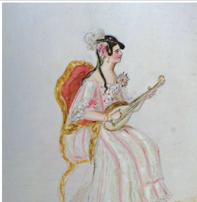
维多利亚画的舞台上的演员。