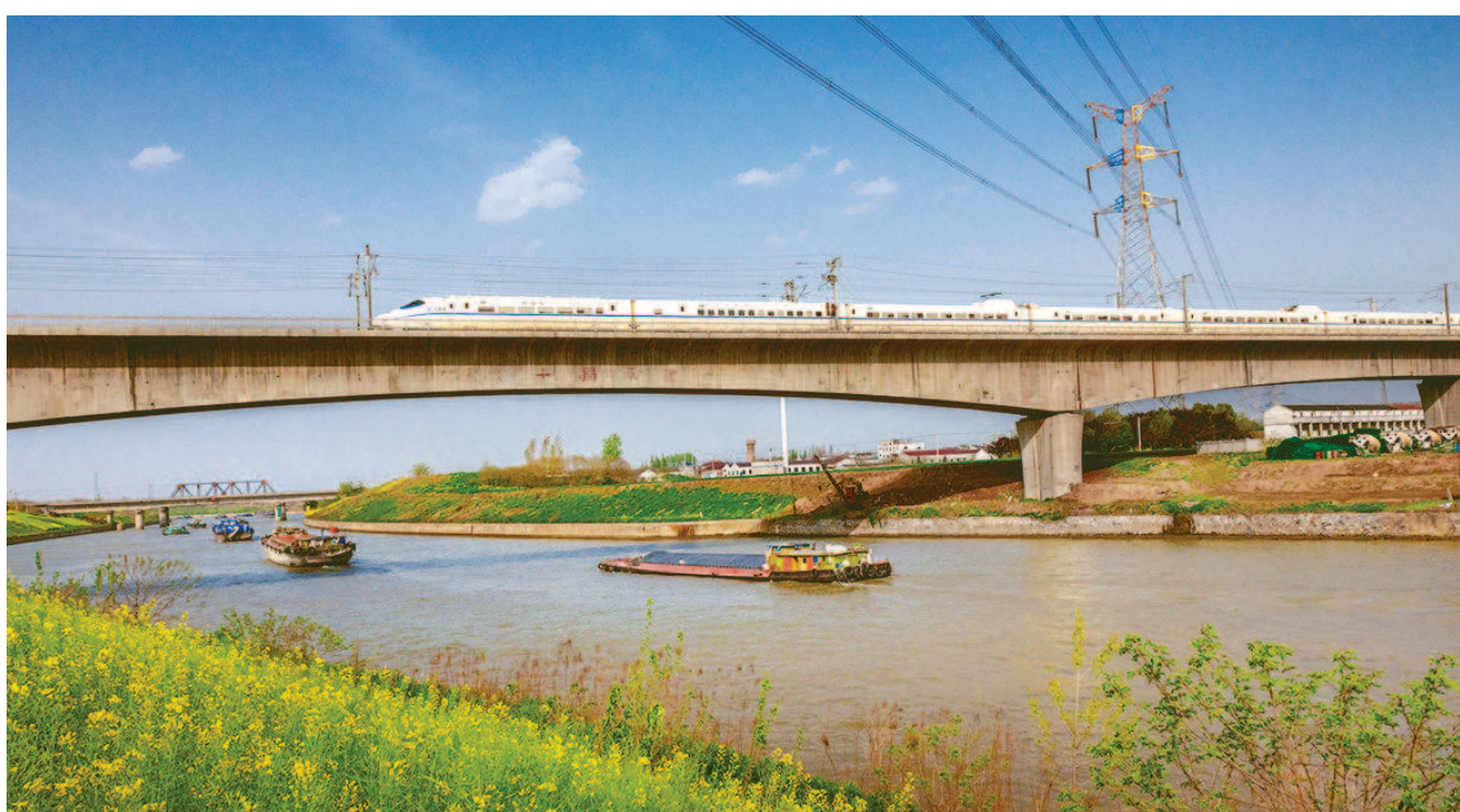
▲高铁飞驰在古运河上 (2018年)