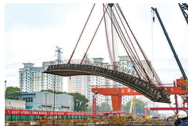
上海轨道交通15号线吴中路站施工现场。

本报讯（记者张晓明）伴随着拱形运架一体机缓缓将最后一块重达17.7吨的预制结构吊装到位，上海轨道交通15号线吴中路站拱形顶板吊装工作昨天顺利完成。此次运用的预制拱形顶板吊装工艺是首次在全国地铁建设中运用。