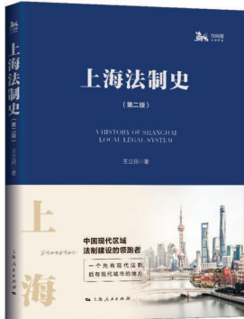
《上海法制史》(第二版) 王立民著 上海人民出版社出版

近代以来，上海的城市建设迅猛发展，百年前就有“东方巴黎”与“东方纽约”之称。而上海的城市发展始终依托于法制建设，其一直为上海的发展保驾护航。要全面、深刻地了解上海，认识、研究上海法制史，特别是近代以来的法制史，就显得十分迫切与必要了。