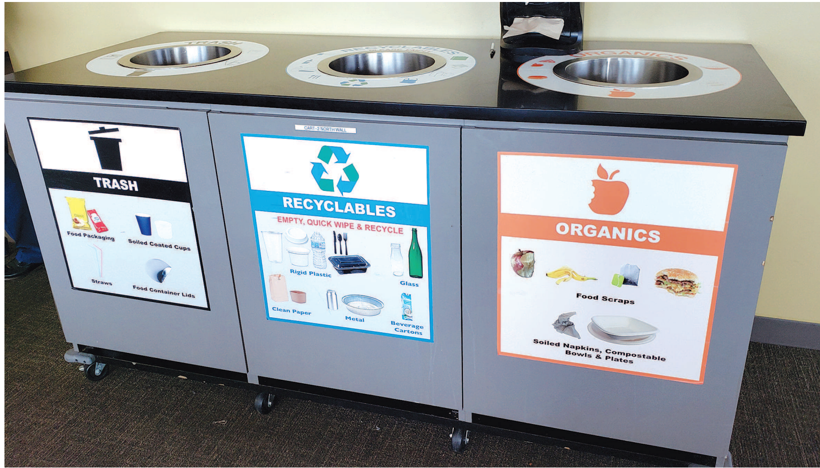
联合国总部餐厅的分类垃圾桶外有清楚的图片和文字说明，垃圾投入哪个桶一目了然。垃圾桶上从左至右分别写着“一般垃圾”“可回收垃圾”和“有机垃圾”。