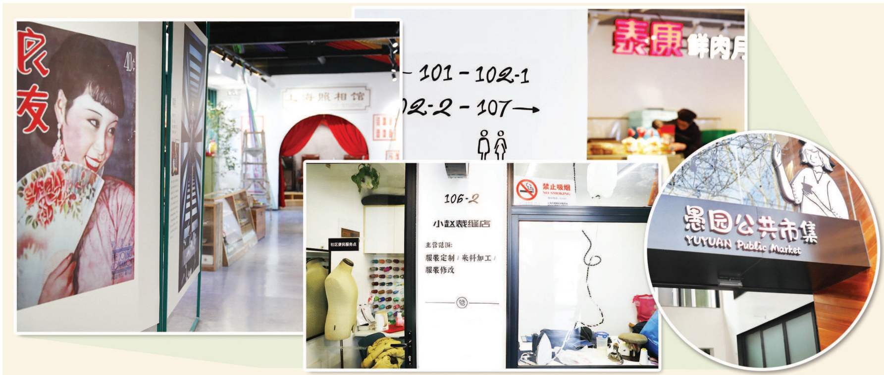
愚园公共市集的一楼引入了智慧菜场、便民超市、食肆等生活服务业态;二楼的社区艺术活动空间则分布着社区美术馆、画廊和舞蹈教室,与一楼浓厚的市井气息相映成趣,为社区居民及周边白领提供各类艺术活动。