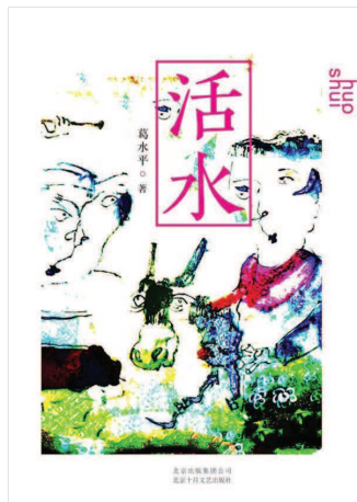
《活水》 葛水平著 北京十月文艺出版社 (2018年12月版)

葛水平的长篇新作《活水》是关于乡土的书写，作家笔归故土，以女性特有的温暖和细腻投去浓浓的人文关切。小说是新时代的乡村创业史，在时代浪潮之下，乡村这片宁静的土地开始躁动不安，人们也面临现代化的冲击。