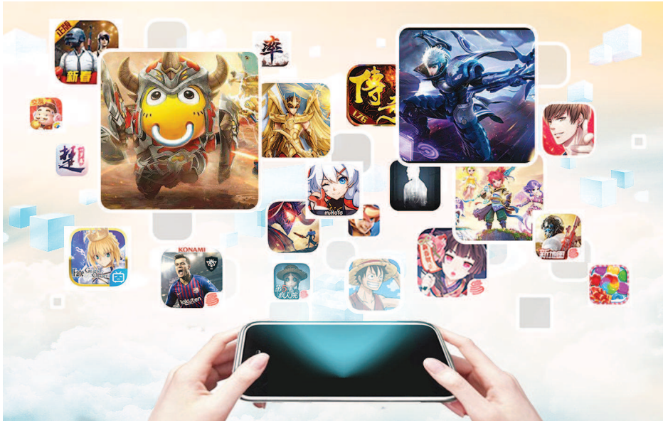
得益于市场利好及多款大IP产品走势良好,游戏产业上升空间很大。 制图:李洁

动漫改编游戏强调代入感,改变的是观众的角色——从浏览者变为体验者。 ▼下转第三版