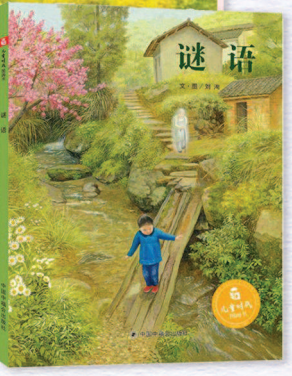
制图：李洁

▲《谜语》 淳朴生动的谜语，详尽描画的自然景观，如同一首关于自然和生命的诗，尽显祖孙之间绵延的亲情，再现了传统节日文化的情感力量