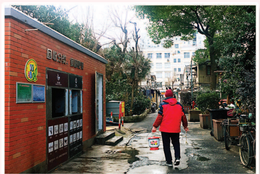
杨浦区辽源新村小区居民即将告别拎着痰盂去公厕的日子。(均资料照片)