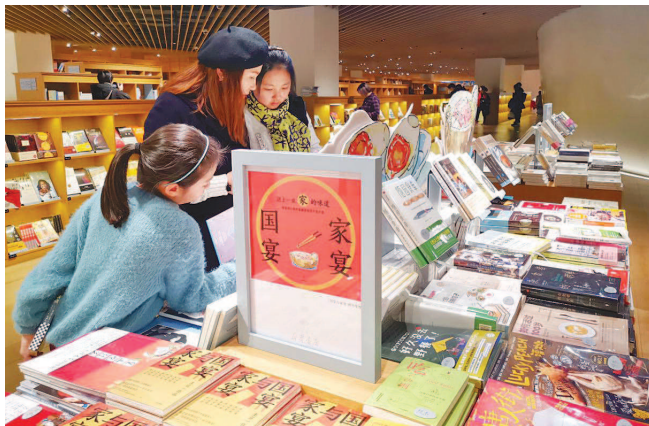
到实体书店阅读“充电”已成过年新风尚。图为光的空间·新华书店的新书陈列。