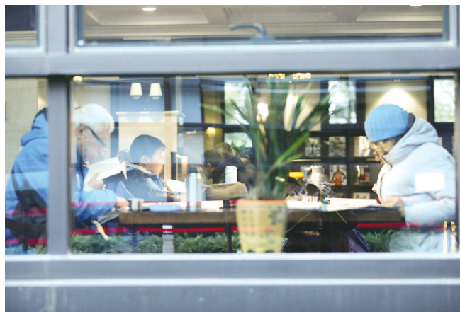
杨浦区图书馆阅览室内读者阅读自习。