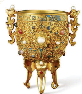
皇帝开笔时要喝一杯酒，用的便是这金甌永固杯

自古以来，春节都可谓中华民族最为珍视的传统佳节。对于古代紫禁城里的天子而言，也不例外。在古代，帝王是国家的象征。正因如此，皇宫里的新年有些特别，兼具家与国的双重意义。 紫禁城里的新年究竟是什么样的？宫灯挂起，年味渐浓。故宫博物院共藏有1400多个宫灯，过节用的器物更是不计其数。2019年春节，这些文物都借着“贺岁迎祥——紫禁城里过大年”特展，重现昔日光辉，首次最大限度还原清代皇宫过大年的场景。 让我们随着故宫博物院研究人员走近这次展览，走近“故”宫里的“新”年。 ——编者