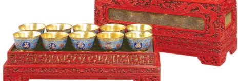
清乾隆朝红飞龙宴盒，是清宫年夜饭时用来为皇上送饭的