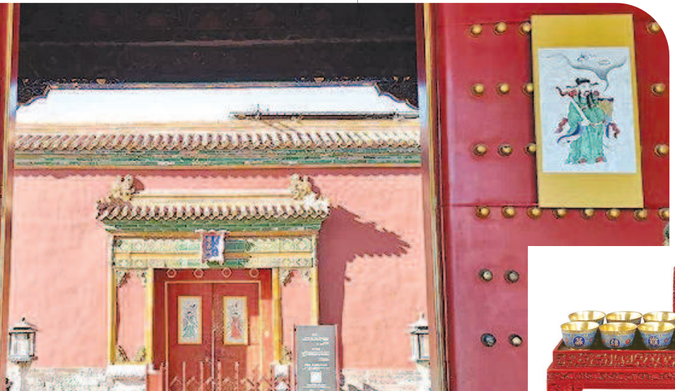
紫禁城里过年，道道宫门都贴上门神