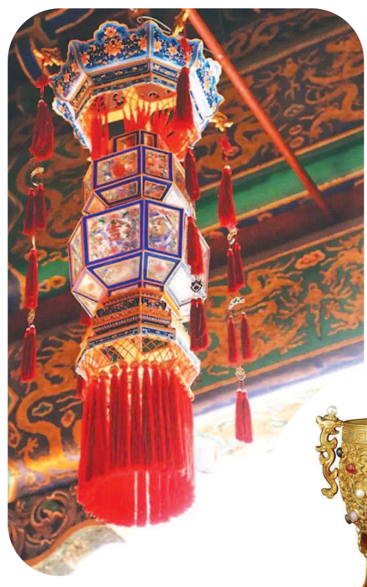
紫禁城里的宫灯挂起，年味便浓了起来