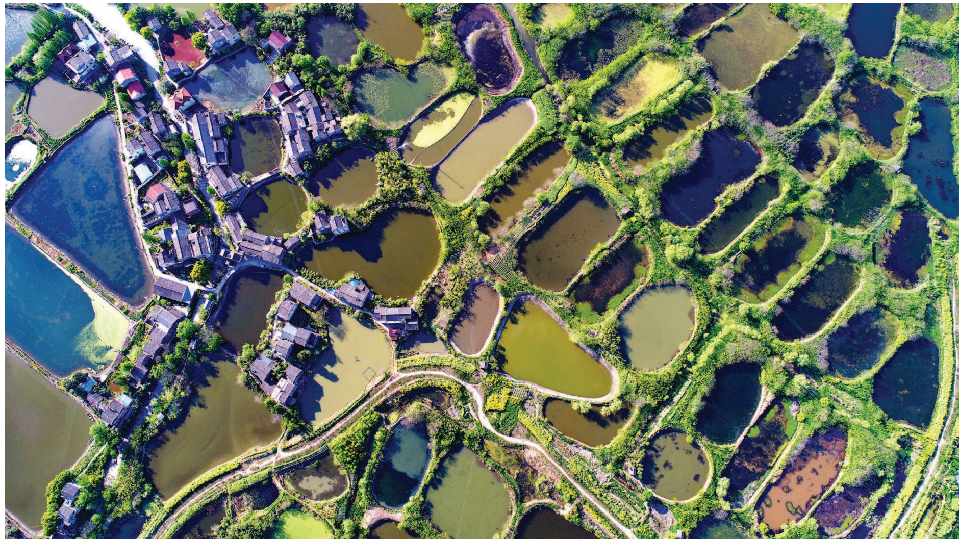
▲从空中俯瞰,成片的网格状桑基鱼塘像一幅浑然天成的画卷。

鱼,在中国传统文化中是富庶、繁荣的象征。无论是逢年过节、喜庆筵席或亲朋好友团聚,中国人的饭桌上总少不了一道鱼肴,透着喜庆,也传达着人们“年年有余”“富贵有余”的美好愿望。