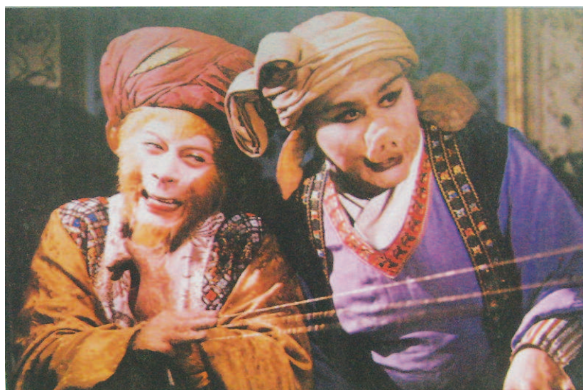
《西游记》中,猪八戒头一次出场时,在与“那闹天官的弼马温”大战前,曝出了自己的来历。

在这段独白中,猪八戒先是说出了自己在上天总督天河水兵的官职,也说出了自己“逞雄撞入广寒宫”被贬下界的原因,以及自己“错投胎”,从相貌堂堂的天兵天将,变成一头刚鬣野