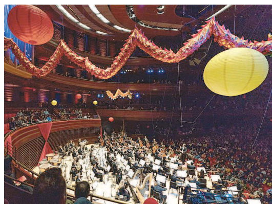
美国费城首届中国新年音乐会29日在金梅尔表演艺术中心举行，近百名中美演奏家同台献演。