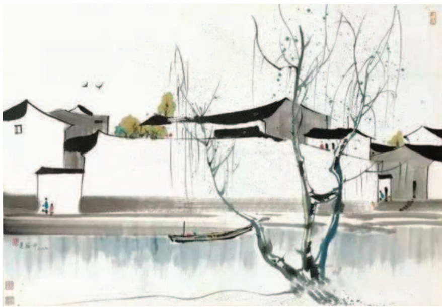
►吴冠中水墨画《江南水乡》

随着长三角一体化上升为国家战略，对江南文化的研究日益重要，相关图书的出版也日渐兴盛。近期上海人民出版社将推出集结江南文化高端学术研究成果的“江南文化研究丛书”，这套丛书从不同学科领域切入，注重跨学科合作，撰写者均为一流专家学者。第一辑八本包括：王家范著《明清江南社会史散论》、吴仁安著《明清