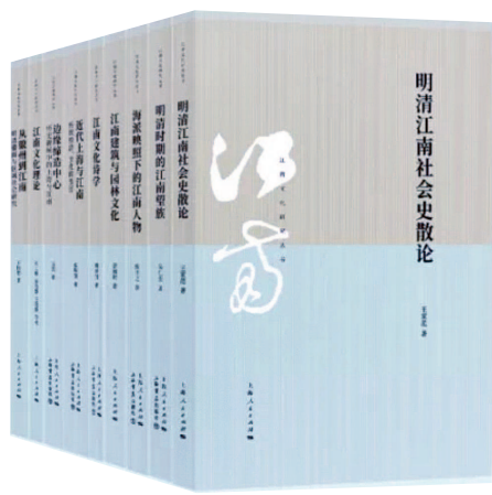
▲“江南文化研究丛书”第一辑