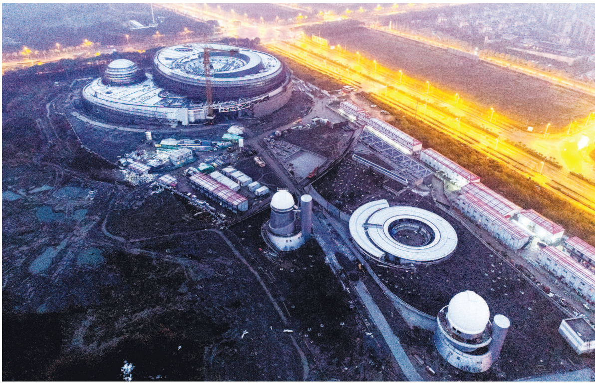
上海天文馆进入内部精装修阶段。未来,上海天文馆将以“塑造全面的宇宙观”为愿景,激发人们的好奇心,充分应用各种最先进的展示技术,结合丰富的陨石、文物及航天实物等,帮助观众认识完整的宇宙,鼓励人们感受星空、分享发现、理解宇宙、思索未来。

本报讯(记者沈淑芬)记者昨天从上海科技馆获悉,经过两年多的施工建设,上海天文馆(上海科技馆分馆)已完成主建筑及附属建筑的结构验收、钢结构大悬挑卸载等关键节点,正在全面推进外幕墙工程和内部精装修工程,预计今年下半年建筑安装工程竣工,2020年底展示工程基本完成,2021年择期开馆。 上海天文馆是我市“十三五”时期重大市政文化公益项目和重要科普基础设施,也是服务上海科技创新中心建设的重要举措。它位于浦东新区临港新城临港大道与环湖北三路口,总用地面积58602平方米,总建筑面积38164平方米,建成后将成为全球建筑面积最大的天文馆。